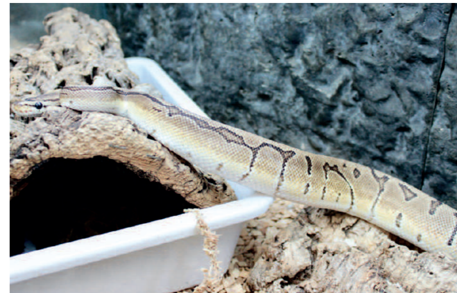
Ein Königspython der Farbmorphe „Spider“ – die angeborenen neurologischen Schäden reichen von dauerhaftem Kopfzittern bis hin zur völligen Orientierungslosigkeit in der Umgebung.

Weniger präsent hingegen ist ein Trend, der zwar ebenfalls überhaupt nicht neu ist, der aber in den letzten Jahren zunehmend extremer und damit problematischer wird: die Züchtung sogenannter Morphen im Reptilienbereich. Die Morphenzucht beschreibt das gezielte Kreieren und Vermehren von Tieren mit bestimmten, von der Wildform der entsprechenden Art teils stark abweichenden, Farb-, Zeichnungs- und sogenannten Gestaltvarianten. Sie steht damit im absoluten Kontrast zur Zucht aus artenschützerischer Sicht, nämlich eine bedrohte Art in ihrer ursprünglichen Form zu vermehren und Zuchtstämme in Gefangenschaft zu erhalten.