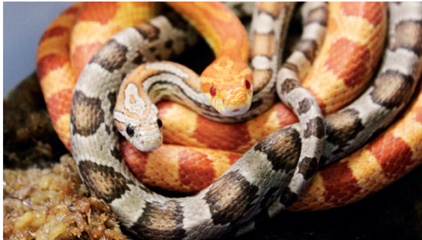
Kornnattern werden schon seit vielen Jahrzehnten in Farb- und Zeichnungsvarianten gezüchtet – vollständig wildfarbene Tiere sieht man so gut wie gar nicht mehr in der Terraristik.

Dazu muss man nicht in die Tropen reisen, lassen sich Stieglitz, Gimpel, Wechselkröte, Ringelnatter, Rotfuchs, Flusskrebs und Co. doch auch daheim beobachten. Auch, dass es innerhalb der Artenvielfalt immer einzelne Exemplare oder auch lokale Schläge gibt, die sich nicht an die „üblichen“ Farbnuancen halten, sollte unsere Demut vor den „Launen der Natur“ noch größer werden lassen. Wenn jedoch der Mensch in die Natur eingreift, sei es aus Geltungs- oder aus Gewinnsucht, führt das in der Regel zu Problemen. Bei unseren Reptilenschützlingen sind dies häufig Probleme, die aus einem fragwürdigen Trend heraus entstehen, der Vermehrung sogenannter Farbzuchten aus Gründen des „Designs“. Die Folgen sind teils schwere körperliche Einschränkungen der Tiere, nicht selten erfüllen sie die Bedingungen des Qualzuchtparagraphen im Tierschutzgesetz. Viele davon landen bei uns im Tierheim. Und es werden immer mehr!