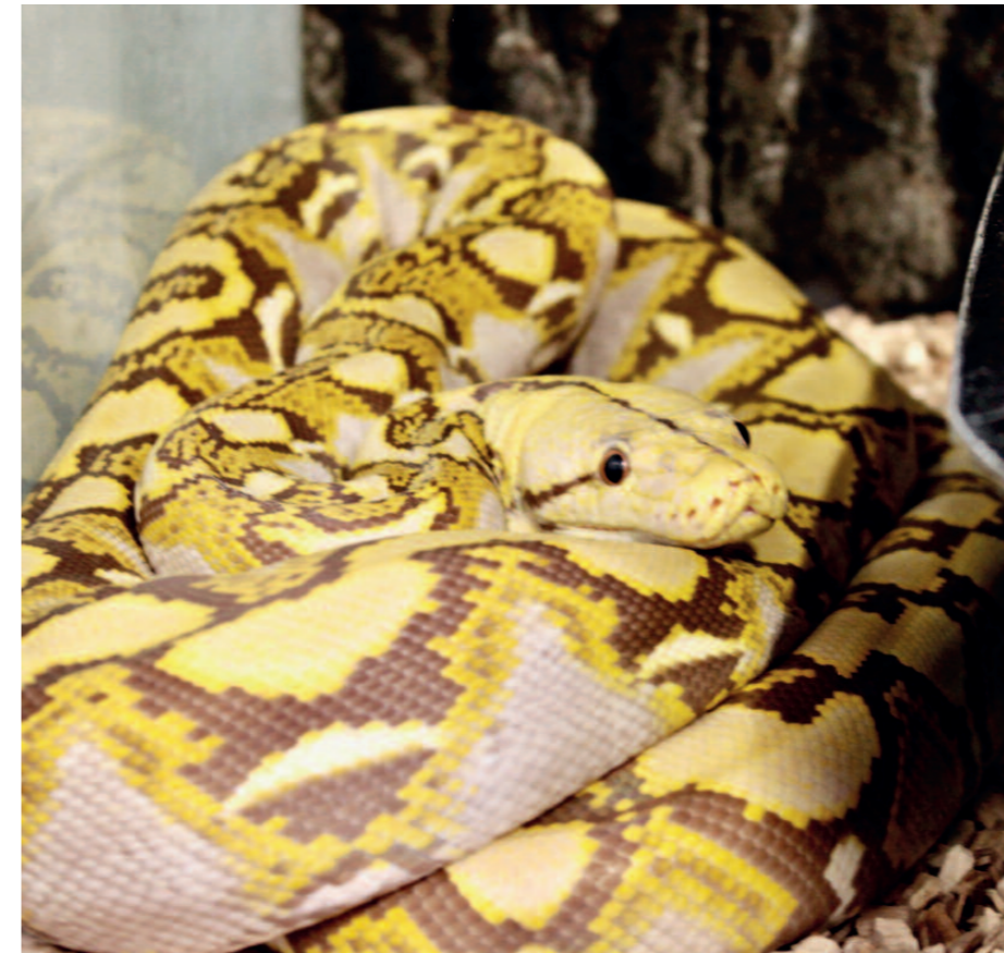
Netzpython der Farbform „Lavender“ – die schwarzen Pigmente sind bräunlich, helle Bereiche schillern in einem lavendelfarbenen Ton.

Fehlende Farbpigmente in der Haut lassen auf eine deutliche Anfälligkeit gegenüber UV-Licht schließen, bei Schlangen häufig kein allzu großes Problem.