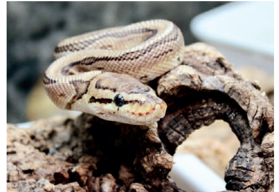
Der Gleichgewichtssinn bei „Spider“-Königspythons ist manchmal so stark gestört, dass die Tiere nicht in der Lage sind, gezielt nach Beute zu schnappen – sie müssen dann zwangsgefüttert werden, um nicht zu verhungern.

Ein wichtiger Baustein in der Evolution der Arten sind Mutationen – kleine und große Veränderungen im genetischen Bauplan eines Individuums, die teils dazu führen, dass ein Embryo sich erst gar nicht entwickeln kann, ein anderes Mal aber dazu, dass ein völlig anders gefärbtes Tier das Ei verlässt. Entsprechend unserer „Grundfarben“ spricht man hier z.B. von amelanistischen (nicht-schwarzen, umgangssprachlich Albino-) Tieren, hypermelanistischen (vermehrt-schwarzen) oder anerythristischen (nicht-roten) Tieren. Echte albinotische Lebewesen bilden aufgrund einer Störung der gesamten Farbstoff-Synthese keinerlei Farbpigmente aus. Die vielen möglichen Bezeichnungen orientieren sich hierbei immer an den Farbpigmenten, die verstärkt, vermindert oder fehlend sein können. Dabei muss dieses Phänomen nicht immer die komplette Haut des Individuums betreffen: Seit vielen Jahren mehren sich Meldungen von Amseln mit vollständig weißen Gefiederpartien, bei diesen ist der Kontrast zum sonst dunklen Federkleid besonders deutlich zu sehen. Hierbei handelt es sich um sogenannte Teil-Leuzisten (leukós = weiß), denen die Melanophoren nur in bestimmten Arealen fehlen. Man geht heute davon aus, dass durch diese Mutationen im Laufe der Evolution ganze Arten, wie beispielsweise unsere heimische Elster mit ihren teils weißen Gefiederpartien auf schwarzem Untergrund, ihr äußeres Erscheinungsbild erlangten.