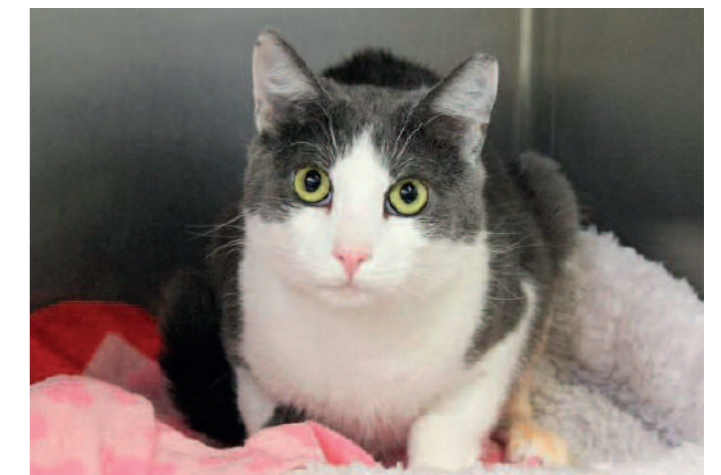
Graumaus und viele andere Katzen mussten ihre Unterkünfte verlassen und umziehen.

Ob das Alte Katzenhaus abgerissen werden muss oder saniert werden kann, stand bei Redaktionsschluss noch nicht fest. Nach aktuellem Stand belaufen sich die Kosten in jedem Fall auf einen mindestens sechsstelligen Betrag, das Gutachten